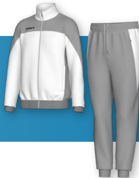
ФКТ - 1603

Полуприлегающий крой. Центральная застежка- молния. Зауженные брюки