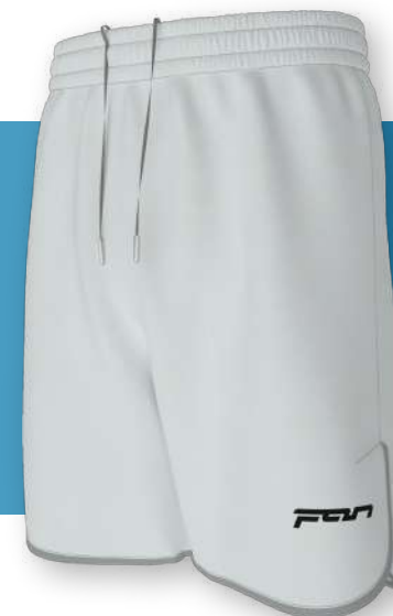
ФТ - 2209

Свободная модель с закругленными разрезами