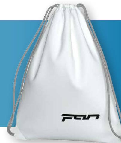
Сумка для обуви