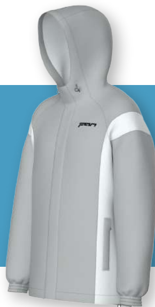
Ветровка - 1505

Стандартная модель прямого кроя с капюшоном