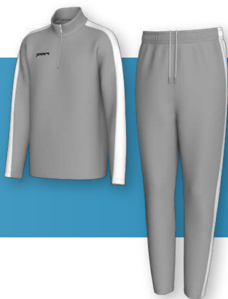
ФКТ - 1501

Полуприлегающий крой. Молния на воротнике кофты. Зауженные брюки