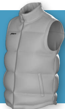
Жилет - 1703

Стандартная стеганая модель прямого кроя с карманами