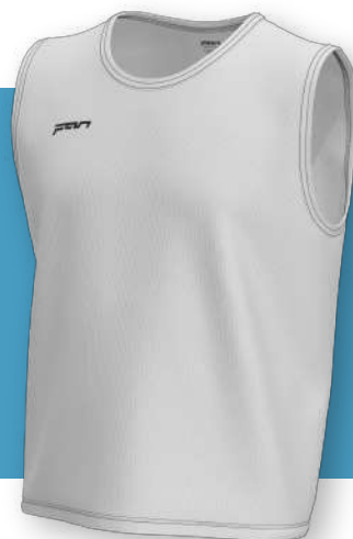
Манишка - 401

Классическая односторонняя модель прямого кроя