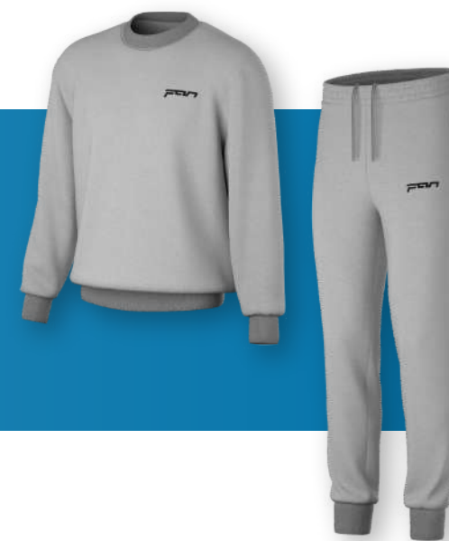
ФКФ - 2123

Классический свитшот с втачным рукавом. Зауженные брюки