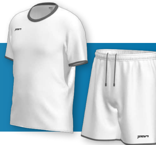
ФФ - 1306

Классическая модель майки со вставками под рукавами. Свободная модель трусов