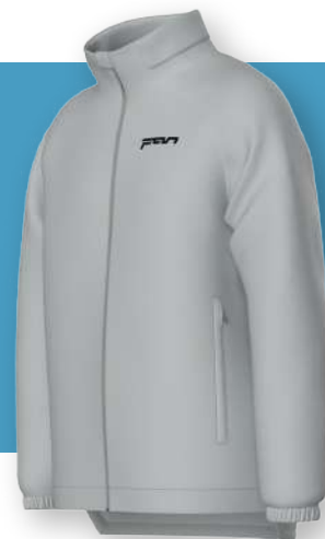
Ветровка - 2203

Удлиненная модель прямого кроя с капюшоном