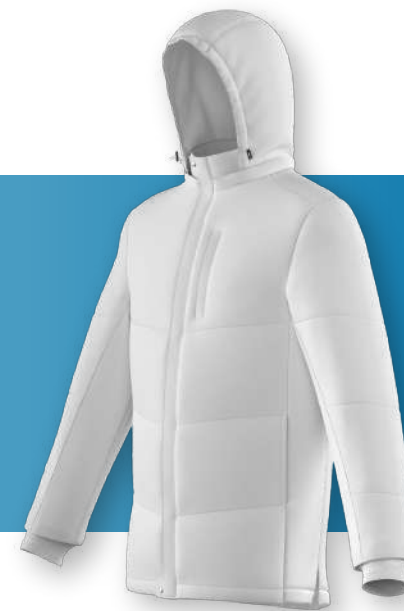
Куртка - 1413

Удлиненная модель прямого кроя с капюшоном